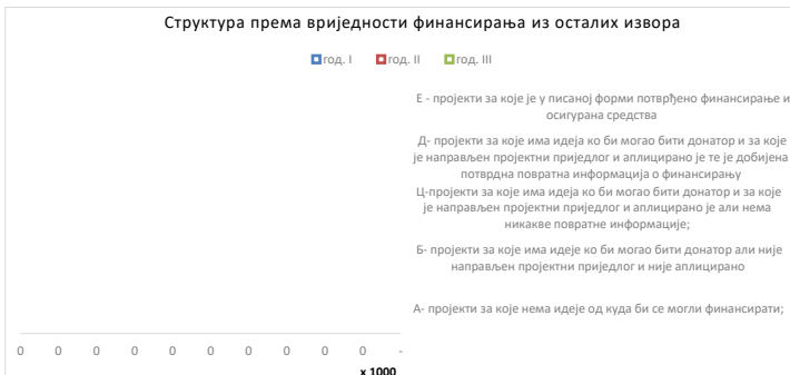
Овај графикон даје визуелни преглед вриједности пројеката планираних из екстерних извора, по годинама и класама (А-Е)