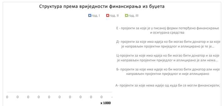
Овај графикон даје визуелни преглед вриједности суфинансирања "екстерних" пројеката од стране ЈЛС, по годинама и класама (А-Е).